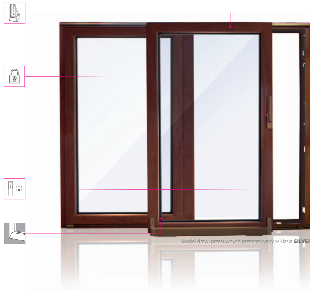
Model drzwi przesuwnych prezentowany w klasie SILVER

Wykonana z trwałego na lata tworzywa kauczukowo-silikonowego, o wysokiej odporności na promieniowanie UV.